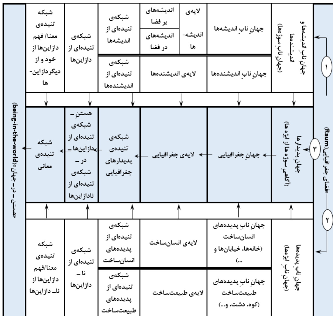
شکل ۴: دستگاه برهان‌های فلسفی - جغرافیایی

اگر با همان الگوی سوژه - ایزه‌ی سنتی که در آن سوژه‌ی مشاهده‌گر در برابر جهانی متشکل از جمیع هستندگان ایستاده است (ملاپری، ۱۳۹۰: ۲۱۸) به فضای جغرافیایی (Raum) بنگریم، می‌توان آن را - در ذهن، و نه در واقعیت -