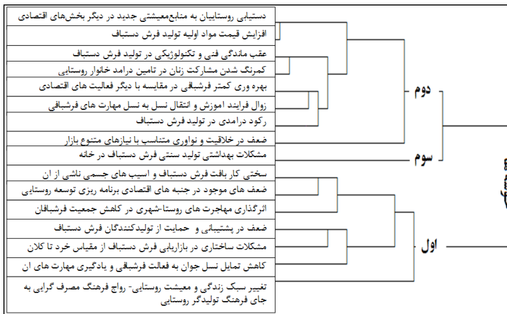
شکل شماره ۱: خوشه بندی علل رکود صنعت قالی بافی در روستاهای مورد مطالعه

در ادامه روش خوشه بندی سلسله مراتبی برای تحلیل علل رکود قالی بافی به کار رفت. بر این اساس شاخص های تأثیرگذار به سه خوشه تقسیم بندی شده اند. نتایج این روش در شکل شماره (۱) نشان داده شده است.