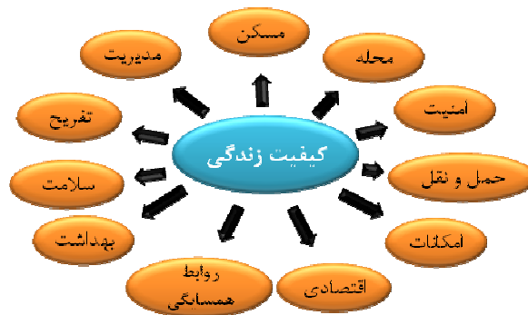
شکل (۲): شاخص‌های پژوهش

از آن جایی که مفهوم کیفیت زندگی شهری، مفهومی چند بعدی و پیچیده می‌باشد، زمانی می‌توان از آن در برنامه‌ریزی شهری استفاده کرد؛ که چهار چوبی مناسب و قابل اطمینان برای سنجش آن تدوین نمود. بنابراین، اولین گام در راستای سنجش کیفیت زندگی شهری انتخاب ابعاد آن و سپس انتخاب شاخص‌هایی است که با استفاده از آن بتوان ابعاد مختلف کیفیت زندگی شهری را مورد سنجش قرار داد (لطفی، ۱۳۸۸: ۷۱). بر این اساس شاخص‌های انتخابی در این پژوهش شامل ۱۱ معیار می‌باشد؛ که در شکل (۲) آمده است.